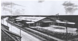
Ægpakkeriet i virkeligheden.

Bygningen er bygget som ægpakkeriet på Viborgvej 6 for Frumentaria a/s og Odense Forretning a/s. Bygningen blev taget i brug i 1938 og blev anvendt indtil 1985. De små sidefløje er efterfølgende revet ned og selve bygningen indeholder nu flere detalhandelsbutikker. Frumentaria var en præserveringsmetode ved anvendelse af en slags auklave.