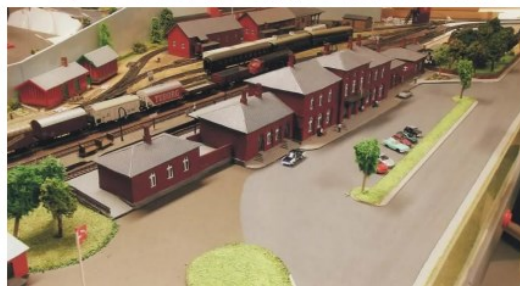
Fotografier af modellen af Den røde Station.

Bygningen er bygget af Erik Christensen.