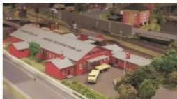
Ægpakkeriet i model.