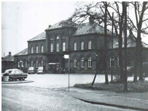
Fotografi af Skive Hovedbanegård. Den gang var Jernbanegade brostensbelagt.

Skive Hovedbanegård er markeret på kortet over Skive Hovedbanegård side 16.